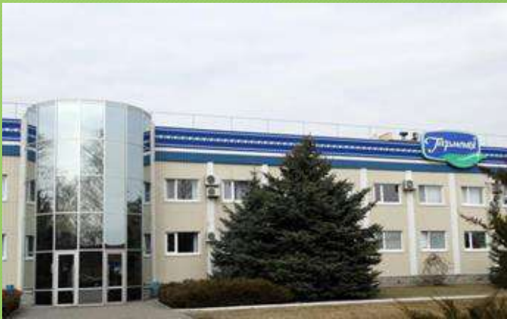
Лубенський молочний завод Полтавська обл. м. Лубни вул. Індустріальна, 2