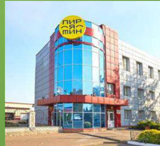
Пирятинський сирзавод Полтавська область, Пирятинський район, місто Пирятин, вулиця Сумська, будинок 1