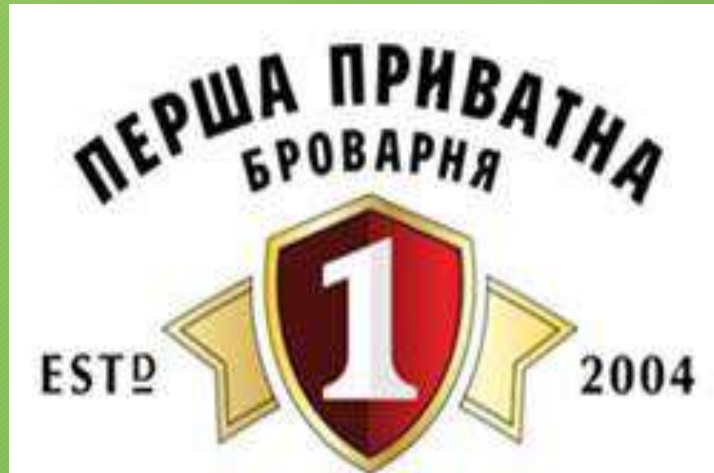
Перша приватна броварня м. Львів, вул. Вашингтона, 10