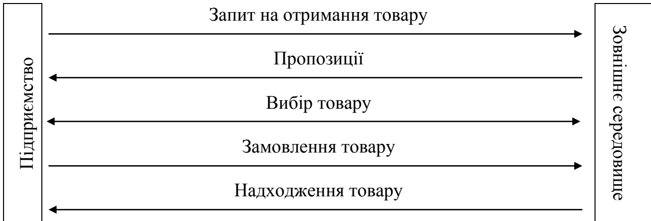
Рис. 1. Схема надходження запасів на підприємство (сформовано автором на основі джерела 1)

Потреба в запасах виражається у формі запиту у зовнішнє середовище - вихідного інформаційного потоку. Відповідальна особа (комірник, менеджер із запасів, бригадир тощо) досліджує наявні товари у магазинах, інтернет-магазинах, телефонує до постачальників чи пише листи у месенджерах чи електронною поштою. На основі отриманих таким чином активних і пасивних пропозицій здійснюється аналіз ринку для забезпечення максимально високих якісних та кількісних характеристик товару за умови мінімізації вартості товарів. Так, визначальними критеріями вибору постачальника є наявність необхідної продукції, її якість та повнота асортименту, умови обслуговування постачальниками, їх місцезнаходження, час роботи, ритмічність та надійність потенційних поставок, умови оплати та поставки, ціна товару та супутніх послуг (транспортування, оформлення тощо).