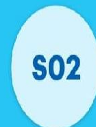
Люпин і діоксид сірки SO 2