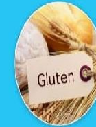
Зернові злаки, що містять глютен