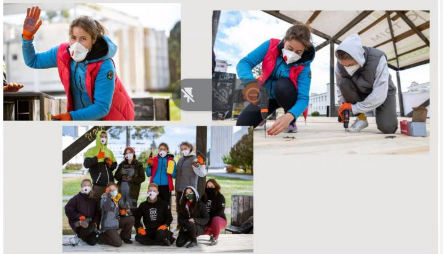
Фото = герой + дія