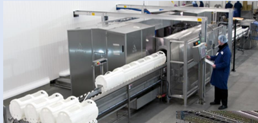
QFP 320L-400 High Pressure Seafood Processing System